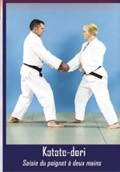
Katate-dori Saisie du poignet à deux mains