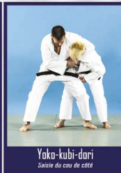
Yoko-kubi-dori Saisie du cou de côté