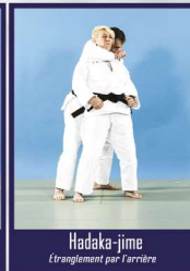
Hadaka-jime Étranglement par l'arrière