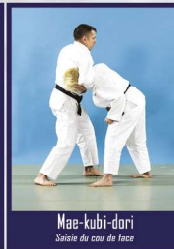
Mae-kubi-dori Saisie du cou de face