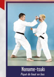
Naname-tsuki Piqué de haut en bas