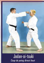
Jodan-oi-tsuki Coup de poing direct haut