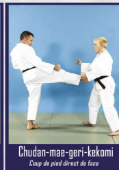
Chudan-mae-geri-kekomi Coup de pied direct de face