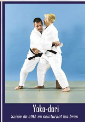
Yoko-dori Saisie de côté en ceinturant les bras