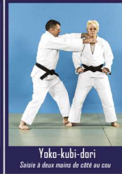
Yoko-kubi-dori Saisie à deux mains de côté au cou