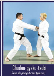
Chudan-gyaku-tsuki Coup de poing direct (plaxus)