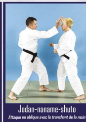
Jodan-naname-shuto Attaque en oblique avec le tranchant de la main