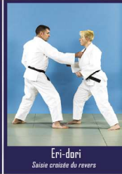
Eri-dori Saisie croisée de revers