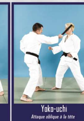
Yoko-uchi Attaque oblique à la tête