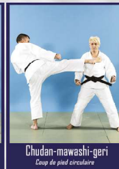
Chudan-mawashi-geri Coup de pied circulaire