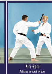
Kiri-komi Attaque de haut en bas