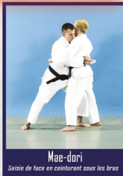
Mae-dori Saisie de face en ceinturant sous les bras