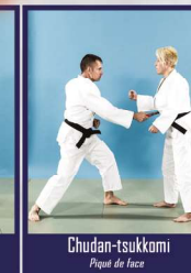
Chudan-tsukkomi Piqué de face