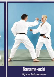
Naname-uchi Piqué de bois en revers